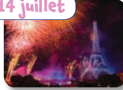
la fête nationale