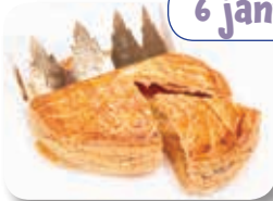
La galette des rois