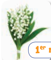
La fête du muguet