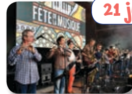
La fête de la musique